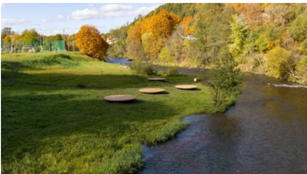
Vilniečių noru – prie Vilnelės atsirado paplūdimio erdvė